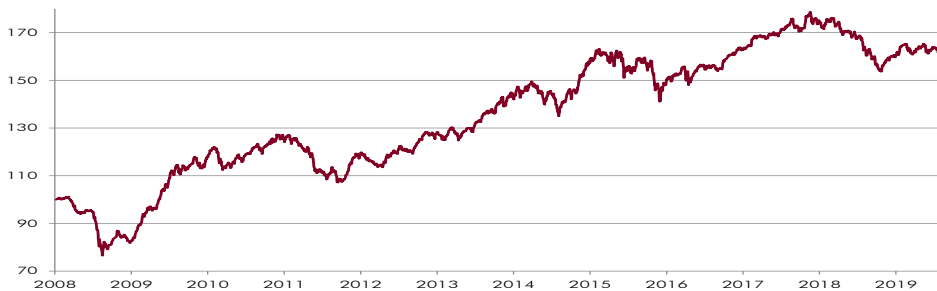
CHART WERTENTWICKLUNG NACH KOSTEN 1)

Quelle: Convertinvest — CONVERTINVEST All Cap Convertibles Fund inst.